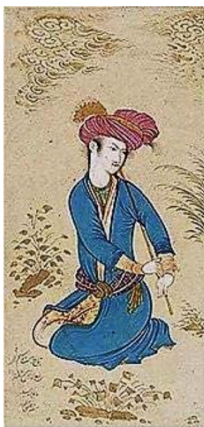
تصویر ۲: معین مصور، «نوازنده نی»، ©موزه بریتیش، لندن، انگلستان (toosfoundation.com). Fig. 2: Mo'en Mosavver, The Ney Player, ©British Museum, London, England (toosfoundation.com).

نظام زیبایی‌شناختی نگارگری قدیم ایرانی که در مکتب اصفهان دچار گسیختگی شده بود، در آثار نقاشی محمد زمان، جای به‌نوعی طبیعت‌گرایی ناکامل می‌دهد؛ موضوع در آثار محمد زمان به دلیل بهره‌گیری از سنت‌های تصویری گذشته ایران، هنر گورکانی هند و رنسانس اروپا در شکل‌های مختلفی بروز کرد. مضامین مورد استفاده در آثارش بیشتر مبتنی بر تحول در سنت تصویری و نقاشی ایرانی است و ترکیبی از مضامین ایرانی و اروپایی را در خود دارد؛ ابرهای پنبه‌ای، درخت شکسته، پوسته ترک‌دار درختان تنومند و تپه‌های سنگی از موتیف‌های پر تکرار در آثار محمد زمان هستند. الگوی روایت و لحن بیانی در آثار محمد زمان، مبتنی بر اسلوب‌های طبیعت‌پردازی و شیوه خاصی از تلفیق عناصر نقاشی ایرانی، اروپایی و هندی است.