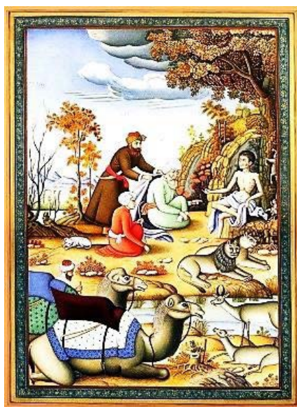
تصویر ۳: محمد زمان، «دیدار خویشاوندان از مجنون»، ۱۰۸۶ ه.ق. (پاکباز، ۱۳۹۴: ۱۳۵۰). Fig. 3: Mohammad Zaman, The Relatives' Visit to Majnun, 1086 AH. (Pakbaz, 2015: 1350).

نظام زیبایی‌شناختی نگارگری قدیم ایرانی که در مکتب اصفهان دچار گسیختگی شده بود، در آثار نقاشی محمد زمان، جای به‌نوعی طبیعت‌گرایی ناکامل می‌دهد؛ موضوع در آثار محمد زمان به دلیل بهره‌گیری از سنت‌های تصویری گذشته ایران، هنر گورکانی هند و رنسانس اروپا در شکل‌های مختلفی بروز کرد. مضامین مورد استفاده در آثارش بیشتر مبتنی بر تحول در سنت تصویری و نقاشی ایرانی است و ترکیبی از مضامین ایرانی و اروپایی را در خود دارد؛ ابرهای پنبه‌ای، درخت شکسته، پوسته ترک‌دار درختان تنومند و تپه‌های سنگی از موتیف‌های پر تکرار در آثار محمد زمان هستند. الگوی روایت و لحن بیانی در آثار محمد زمان، مبتنی بر اسلوب‌های طبیعت‌پردازی و شیوه خاصی از تلفیق عناصر نقاشی ایرانی، اروپایی و هندی است.