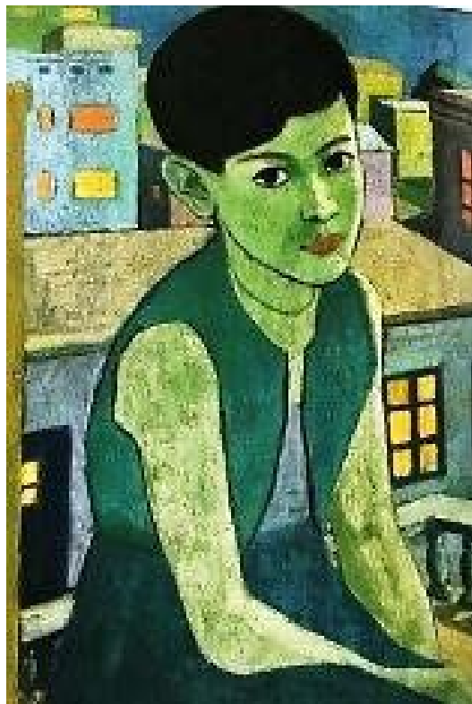
تصویر ۶: محمود جوادی پور، بدون عنوان، ۱۳۲۷ ه.ش.، رنگ روغن، © موزه هنرهای معاصر تهران (دل‌زنده، ۱۳۹۵: ۱۸۸). Fig. 6: Mahmoud Javadipour, Untitled, 1948 CE, Oil on Canvas, ©Museum of Contemporary Art Tehran (Delzende, 2016: 188).

روان‌شناسانه و درونی به موضوع نقاشی داده است. فاصله نزدیک با مدل ترسیم‌شده که جایگاه و زاویه دید نقاش را به نمایش می‌گذارد، مکان روایت را با افق دید محدود به مخاطب القاء می‌نماید. عدم حجم‌پردازی رنگ‌ها و سطوح ما را به یاد نگارگری ایران می‌اندازد، ولی تغییر اندازه سطوح و گزینش دور و نزدیک در تصویر (پرسپکتیو) مغایر با سنت‌های گذشته نقاشی ایران است. جوادی پور در آثارش با انتخاب موضوعات محلی و بومی، و استفاده از مضامین مرتبط با موضوعات انتخاب شده، لحن روایی و سبک اجرایی تقریباً نزدیک به واقعیت برگزیده است؛ موتیف به‌کار رفته در آثار او، بیشتر مبتنی بر رنگ و روش‌های اجرایی است. تأکید بیشتر بر وجه نوگرا و متمایز بودن رنگ به جای فرم در آثار این هنرمند غلبه دارد.