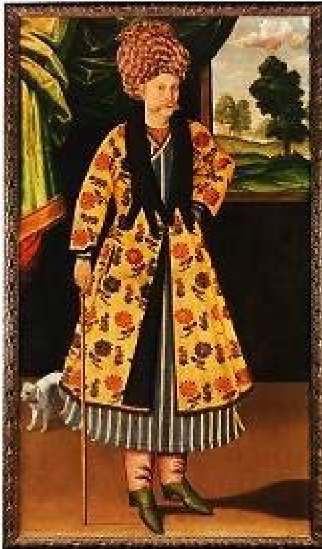
تصویر ۴: علیقلی جبادار، «سفیر» (آزند، ۱۳۹۳: ۹۸).

از هنرمندان هم عصر محمد زمان می توان به «علیقلی جبادار: اشاره کرد؛ وی در زمان شاه عباس دوم در مقام جبادارباشی (مسئول اسلحه خانه) و نقاش دربار فعالیت می کرده و بعداً نیز تا دهه دوم سده ۱۲ به کار نقاشی در دربار صفوی ادامه داده است. تسلط نسبی جبادار در طبیعت پردازی (به ویژه در چهره و جامه پیکرها) از خصوصیات بارز نقاشی هایش است. ۳ موضوع در آثار جبادار از فیگورهای انسانی که با حالتی رسمی در فضای داخلی ایستاده اند متشکل شده است؛ نمایی از فضای بیرونی همانند آن چه در سنت نقاشی غربی مرسوم بود در پنجره رو به طبیعت تصویر شده است. بیشترین مضمون به کار رفته در آثار جبادار، حاکی از گرایش به طبیعت پردازی و واقع پردازی دارد و در پی به تصویر کشیدن هرآن چه در محیط پیرامون نقاش اتفاق افتاده است، دارد. تکنیک و اجرای دقیق و منطبق بر واقعیت از موتیف های تکرار شونده در آثار جبادار هستند؛ اما آن چه در لحن و الگوی روایت آثار جبادار به چشم می آید، حالت تصنعی مدل (انگار معلق در محیط پیرامونی خود است) و خالی از هرگونه معناست.