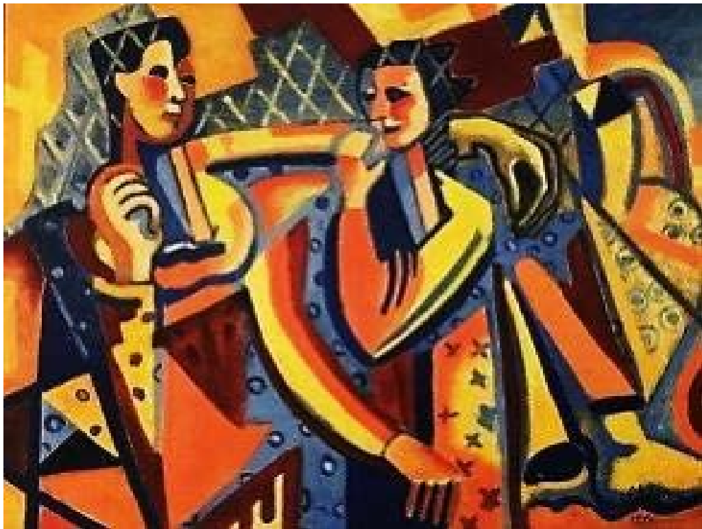
تصویر ۷: احمد اسفندیاری، «دو دل‌داده»، ۱۳۳۰، رنگ‌روغن روی بوم، © موزه هنرهای معاصر تهران (کشمیرشکن، ۱۳۹۴: ۷۲). Fig. 7: Ahmad Esfandiari, Two Lovers, 1951, Oil on Canvas, ©Museum of Contemporary Art Tehran (Kashmirshaken, 2015: 72).

نقاشی اسفندیاری را مشخص می‌سازد. درونمایه این تصویر بیشتر بر وجه نوگرا بودن و تمایل به نشان دادن نسبت خود با هنر مدرن غربی (کوبیسم) استوار است، تا نشان دهنده دل‌دادگی دو عاشق باشد؛ همان‌طور که اشاره شد موتیف در آثار اسفندیاری با تأکید بر رنگ آبی و خطوط کناره‌نما در آثارش قابل شناسایی است. الگوی روایت شکل‌گرفته در آثار اسفندیاری، تمایل بیشتر به سمت نقاشی مدرن غربی و تجربه‌گرایی در سبک‌های مختلف اجرایی را رقم زده است.