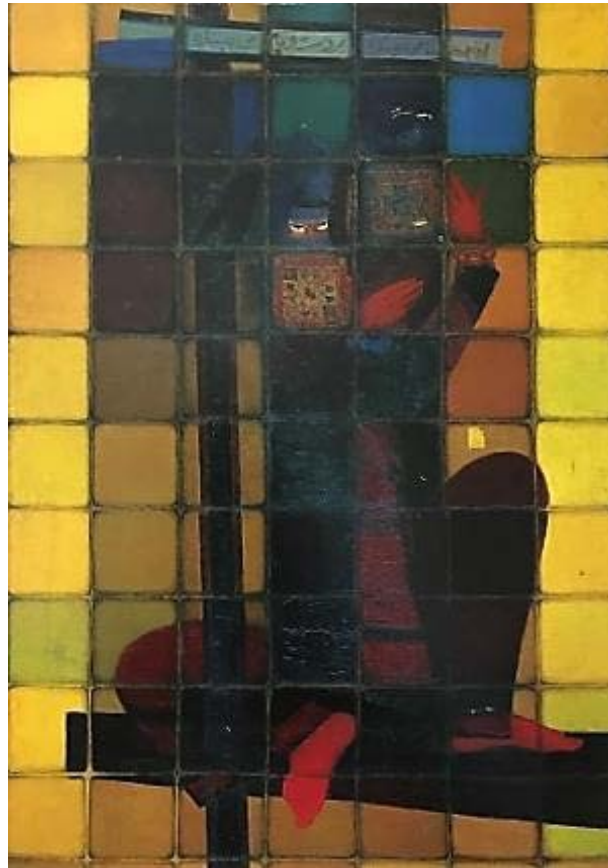
تصویر ۵: جلیل ضیاءپور، «آقام حنا می‌بنده»، رنگ‌روغن روی بوم، ©موزه هنرهای معاصر (کشمیرشکن، ۱۳۹۴: ۶۳). Fig. 5: Jalil Ziapour, Agha Hamna is Binding, Oil on Canvas, ©Museum of Contemporary Art (Kashmirshaken, 2015: 63).

برمی‌گزیند، و ساختار نقاشی‌هایش را در این واحدهای رنگی پویا، شکل می‌دهد (تصویر ۵). این تابلوها با خطوط شکسته و زاویه‌دار در متن مربع‌ها ساخته شده‌اند و در واقع عمل به پیشنهادهایی بود که از سال ۱۳۲۷ ه.ش. در زمینه تحول زبان نقاشی نوگرا براساس میراث ملی در مجامع هنری ارائه کرده بود (همان). موضوعات بومی (فیگورهای عشایر، زنان با لباس محلی و...)، مضامین مدرنیستی و نوگرا (تغییرات فرمی، ساده‌سازی اشکال و...) و استفاده از موتیف مربع (یادآور کاشی‌کاری‌های ایرانی)، لحن و سبک دورگه‌ای را در الگوی روایت آثار جلیل ضیاءپور حاصل کرده است.