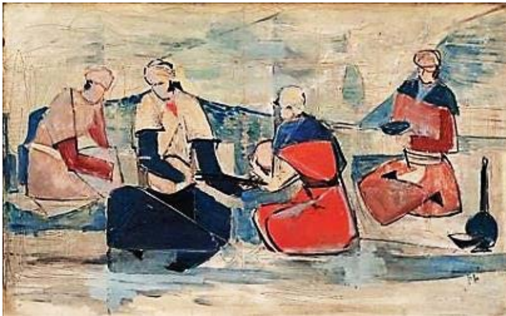
تصویر ۸: حسین کاظمی، «بزم»، رنگ روغن روی فیبر (دل‌زنده، ۱۳۹۵: ۲۴۸). Fig. 8: Hossein Kazemi, The Gathering, Oil on Fiber (Delzendeh, 2016: 248).