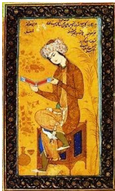
تصویر ۱: رضا عباسی، «خواننده جوان»، © موزه بریتیش، لندن، انگلستان (dailyartmagazine.com).

۱۵۲ و ۱۵۳). بدین‌سان، رضا عباسی از آن قانون‌مندی‌های زیبایی‌شناختی دقیق و پیچیده که در خلال چند قرن تجربه حاصل شده بود، عدول کرد؛ در واقع، در هنر او خط بر رنگ فایق آمده است. الگوی روایت در آثار رضا عباسی را براساس انتخاب موضوع، مضمون، موتیف و لحن روایی به‌کار رفته در آثارش می‌توان بازشناخت. موضوعات استفاده شده در آثار رضا عباسی، بیشتر مبتنی بر فیگورهای انسانی و متناسب با پوشش و آداب و رسوم زمانه خود نقاش انتخاب شده‌اند. مضامین نگاره‌ها نیز متناسب با فضای تصویر شده بیشتر بر درونمایه‌های عاشقانه و تغزلی استوار شده است. موتیف به‌کار رفته در آثار رضا عباسی همان خطوط سیال و آزاد است که مهم‌ترین ویژگی آثارش را رقم‌زده است. درخصوص لحن روایی آثار رضا عباسی، بیانی آرام و موزون شکل‌گرفته است. نقاش در پی ایجاد فضایی برش‌خورده از واقعیت، کمترین عناصر تصویری، رنگ‌های محدود و انتخاب لحظه‌ای گذرا در زمان، به این بیانگری دست یافته است.